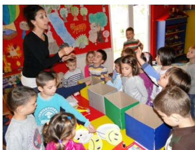
Radionica u vrtiću, Podgorica, maj 2011.

NVO Green Home je podržala kampanju „Ekoloska nit koja nas spaja“ u organizaciji Ministarstva turizma i održivog razvoja kroz organizaciju, pripremu i održavanje edukativnih radionica u školama i vrtićima. Pored organizacije događaja, u sklopu kampanje Green Home je donirala sredstava za realizaciju aktivnosti za pet nevladinih organizacija.