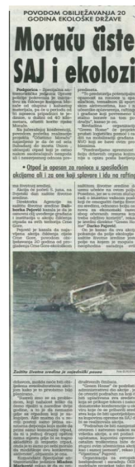
Dnevna novina Vijesti, jun,