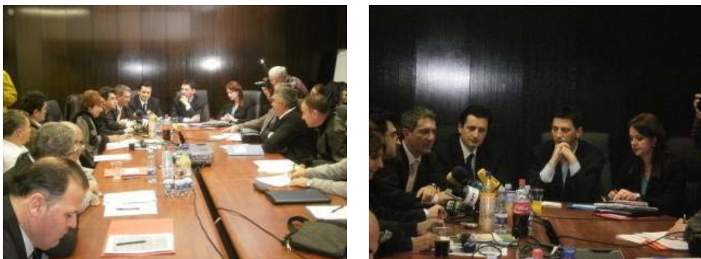
Pripremni sastanak Foruma za životnu sredinu, Podgorica, septembar 2011.

Projekat je realizovan u saradnji sa NVO Pescares iz Italije i podržan od Evropske komisije, Direktorata za životnu sredinu.