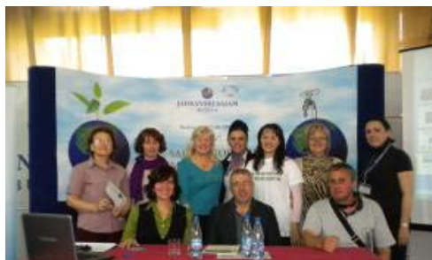
Učešće N2IC na 17. Sajmu ekologije, Budva, april 2011.