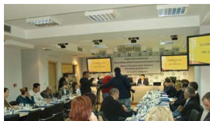
Regionalna konferencija, Podgorica, decembar 2011.

Organizovana konferencija 15. decembra 2011. godine, kojoj je prisustvovalo oko 50 učesnika predstavnika nadležnih ministarstava, državnih institucija, privatnih kompanija i nevladinih organizacija iz Crne Gore i regiona.