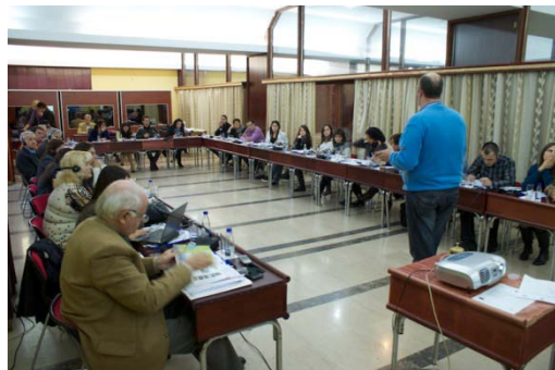
Radionica, Cetinje, novembar 2011.

Projekat je realizovan u saradnji sa Institutom za zaštitu prirode u Albaniji (INCA) i Prekograničnim forumom za Skadarsko jezero, a podržan je od strane Delegacije Evropske unije u Crnoj Gori i Albaniji u okviru IPA prekograničnog programa Albanija - Crna Gora 2007-2013.