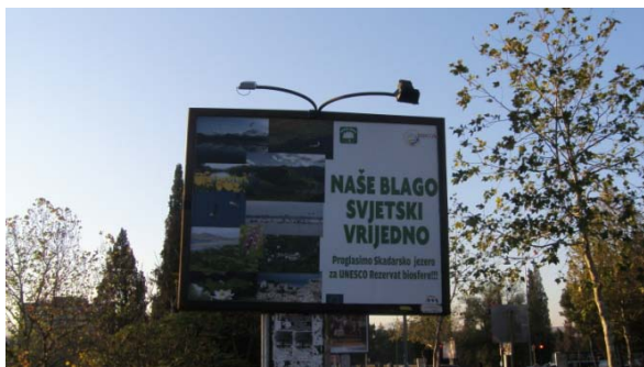
Bilbord u bulevaru Svetog Petra Cetinjskog, Podgorica, novembar 2011.