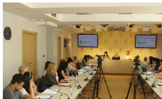
Radionica, Podgorica jul 2011.