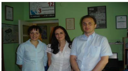
Inicijalni sastanak sa NVO Ecologic, Podgorica, jul 2011.