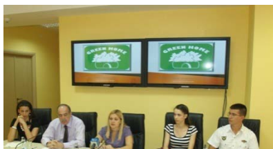
Konferencija za novinare, Podgorica, jul 2011.