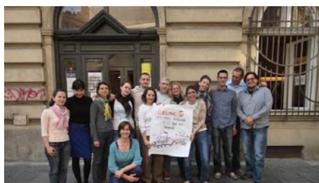
SEA Change radionica, Beograd, april 2011.