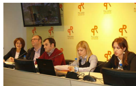
Konferencija za novinare, Podgorica, mart, 2011.

Unapređenje zaštite biodiverziteta Skadarskog jezera kroz osnaživanje prekogranične saradnje Crne Gore i Albanije i promocija jezera kao potencijalnog UNESCO zaštićenog područja, rezervata biosfere iz programa Čovjek i biosfera.