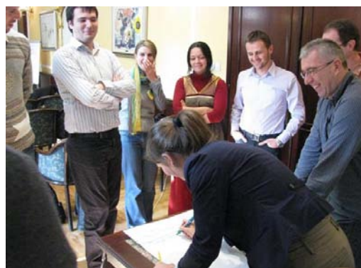
Trening, Podgorica, novembar 2011.