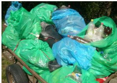
Dio prikupljenog otpada iz rijeke Zete, avgust 2011.