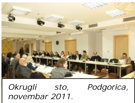
Okrugli sto, Podgorica, novembar 2011.