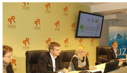
Okrugli sto, Podgorica, decembar 2011.

Projekat se realizuje u saradnji sa NVO Exeditio, a podržan je od strane Fondacije Institut za otvoreno društvo, predstavništvo u Crnoj Gori.