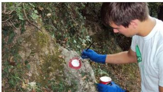
Obilježavanje staze u park šumi Savina, Herceg Novi, septembar 2011.