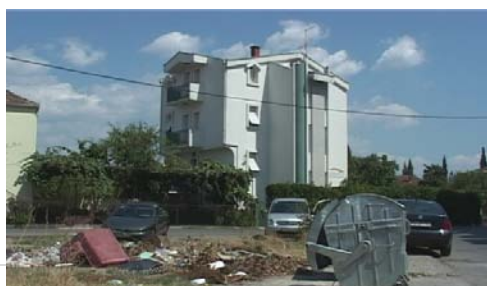
Ul. Crnogorskih serdara prije akcije sadnje, Podgorica, avgust 2011.

Projekat je realizovan u saradnji sa TV Vijesti, a podržan je od strane Ambasade Sjedinjenih Američkih Država.