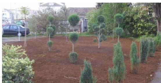
Ul. Crnogorskih serdara nakon akcije sadnje, Podgorica, novembar 2011.