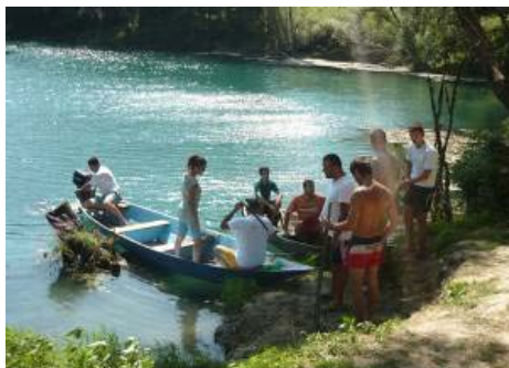
Akcija čišćenja, Danilovgrad, avgust 2011.