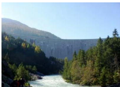
Studijska posjeta rijeci Spul u NP Zarnez, Švajcarska, oktobar 2011.