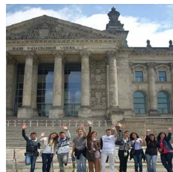
Putujemo u Evropu, Berlin, jul 2011.